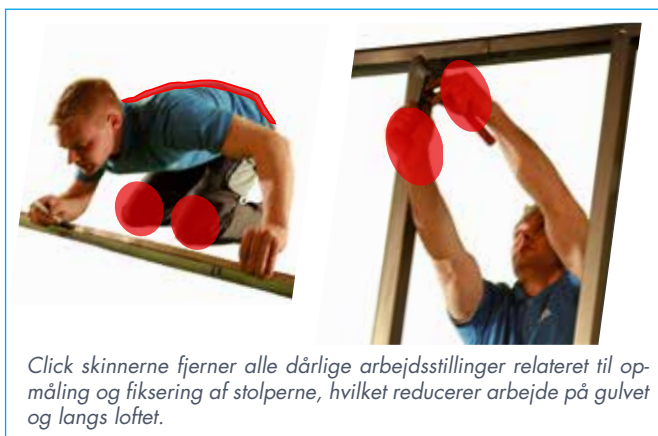
Click skinnerne fjerner alle dårlige arbejdsstillinger relateret til opmåling og fiksering af stolperne, hvilket reducerer arbejde på gulvet og langs loftet.

Med Click skinner undgår man dårlige arbejdsstillinger relateret til opmåling og fiksering af stolperne, hvilket reducerer arbejde på gulvet og langs loftet. Samtidig er stolperne stabilt fikseret, så de ikke kan vælte eller flytte sig under arbejdet.