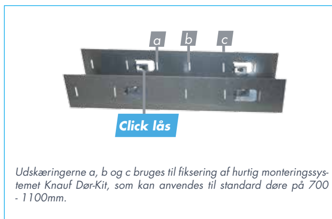
Udskæringerne a, b og c bruges til fiksering af hurtig monteringsystemet Knauf Dør-Kit, som kan anvendes til standard døre på 700 - 1100mm.

Udskæringerne a , b og c bruges til fiksering af det hurtige monteringsystem Knauf Dør-Kit, som kan anvendes til standard døre på 700 - 1100mm. Modulmålet på Dør-Kit låsehullerne er 50 mm og sikrer, at dørhullet kan placeres med en tolerance på 25 mm.